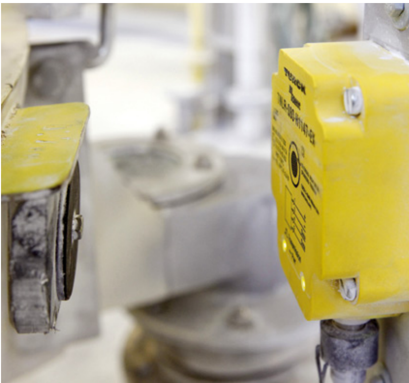
Ein Ex-Schreiblesekopf im robusten Q80-Gehäuse liest die Maschenweite des Siebs aus dem Datenträger aus, der direkt am Siebrand (I.) befestigt ist

Dazu wird jeder der 20 DN80-Schläuche mit einem Datenträger versehen, der die individuelle Schlauchnummer enthält. Jedes Ziel bekommt einen kompakten Schreiblesekopf. Wird ein Schlauch angekoppelt, liest das System die zugehörige Nummer aus und gibt den Betrieb frei, sofern alles korrekt angeschlossen ist. Im Projekt Schlauchbahnhof liefert Turck über die Tochter Turck mechatec eine anschlussfertige Lösung, die mit einem kundenspezifischen Steckverbinder versehen und voll vergossen wird. ■